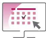
Planification du scrutin

Toute opération de vote doit se dérouler dans le respect de la réglementation électorale en vigueur et du protocole pré-électoral négocié. Bénéficiez de l'expertise et de l'accompagnement sur mesure de Cortex pour garantir le bon déroulement de vos élections.