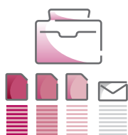
Conception, production et transmission du matériel de vote